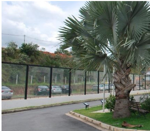
Ilustração do Padrão de muro com vidro a ser seguido

Serão executados muros de arrimos e fechamento com vidro, no padrão existente na testada da Câmara Municipal de Louveira, mantendo-se altura, espessuras e acabamentos.