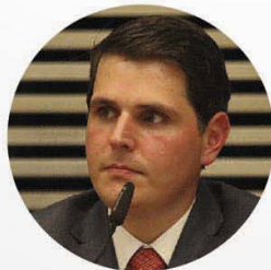
Cauê Macris Deputado Estadual Presidente da Assembleia Legislativa de São Paulo